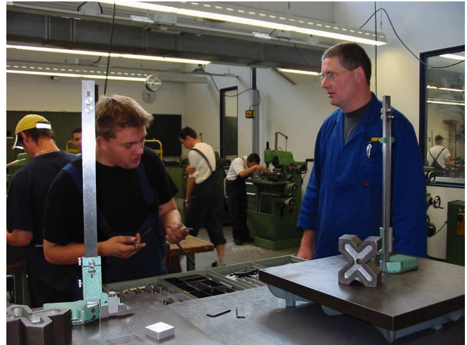
Abb.: Genauigkeit ist Voraussetzung für Qualität

Unsere bbs|me – Otto-Brenner-Schule arbeitet eng mit den Ausbildungsbetrieben zusammen. Der Unterricht erfolgt im ersten Ausbildungsjahr an zwei Schultagen. Die Fachtheorie wird in der Berufsschule im ersten Jahr nach Lerngebieten und ab dem zweiten Jahr in handlungsorientierten Lernfeldern unterrichtet. Nach dem dritten Ausbildungsjahr findet die Abschlussprüfung in Theorie und Praxis vor dem Prüfungsausschuss der IHK statt.