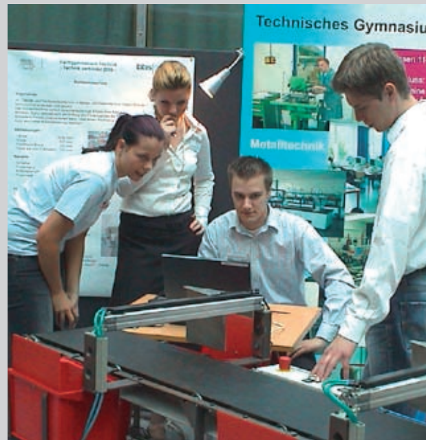
Bild: Das Berufliche Gymnasium Technik beteiligt sich jedes Jahr mit Beiträgen an Wettbewerben wie „Jugend forscht“ oder „Invent a chip“ und an der „Ideen-Expo“ und anderen Messen. Unsere Schülerteams konnten dabei schon manchen Preis erringen.

An unserem Gymnasium durchgeführte vergleichende Untersuchungen haben ergeben, dass ca. 70% unserer Schülerinnen und Schüler sich durch die Ausbildung an unserer Schule gut oder sehr gut auf ihr Studium vorbereitet fühlen. Das ist ein Spitzenwert, der weit über dem Durchschnitt aller untersuchten Gymnasien liegt.